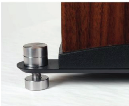
FM-6 viritetty vaateriin käden käänteessä.

OK, ei ammuta viestinviejää. Kytetään sen sijaan kehiin mustaa muovia kieputtavaa kansanperinnettä EMT-tuotemerkin hallinnoimalta audion osa-alueelta. Ja koska AMP-150:n phono-otto on MM, asettelemme signaalitiel-