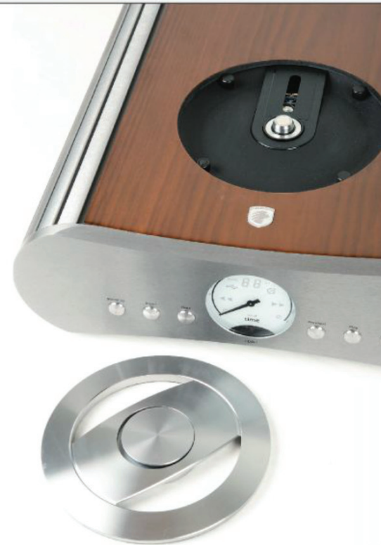
CDD-1:n levyklamppi on magneettitoiminen.

FM-6:n bassotoiston kerrotaan ulottuvan 6 desibelin vaimenuksella 38 hertsiin. Herkkyydeksi mainitaan 90 dB/W ja nimellisimpedanssiksi 4 ohmia.