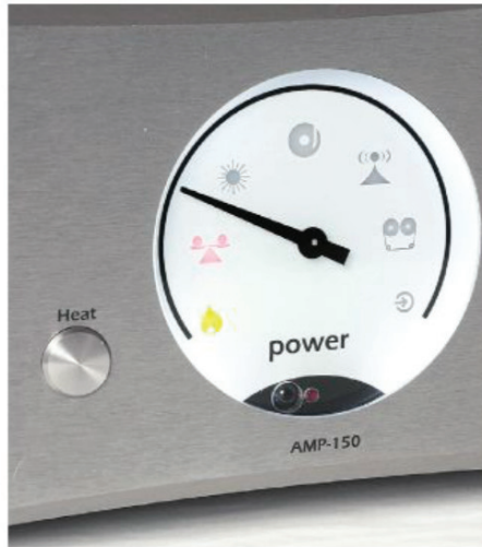
Lämpöä konehuoneeseen HEAT-toiminnolla: valmius vaativaan kuunteluun vartissa!

Tanskan Herlevissä tyylikkyyttä taikoava Gato Audio tekee/teettää myös kaapeleita. Siitäkin huolimatta, että yritys haluaa sanoutua irti kaapeleihin liittyvästä mytologiasta. Gato kuoruttaa kuparijohtimet hopealla ja eristää ne teflonilla. Jäykkä ja tiukka rakenne